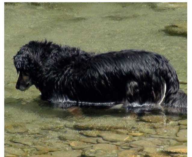
Baden erlaubt – aber bitte im Fluss und nicht im Tümpel.