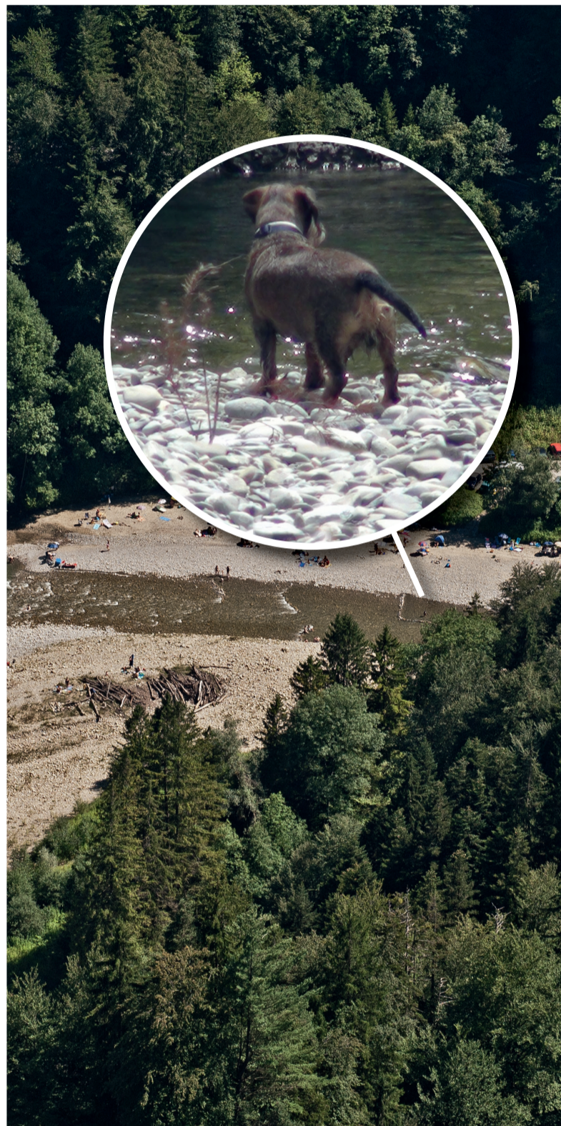
Sensegraben. Foto: www.reportair.ch , Lupe: Franziska von Lerber

Die Artikel können unter www.gantrisch.ch/natur heruntergeladen werden.