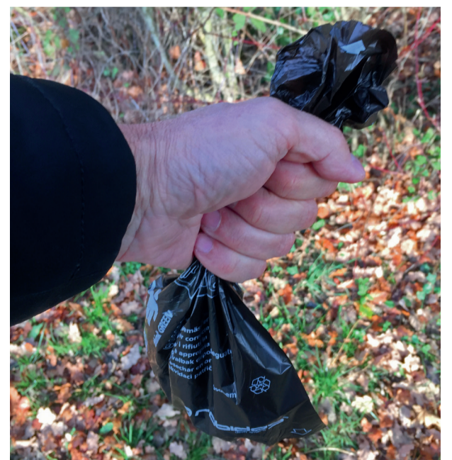
Mit einem Robidog-Beutel lässt sich der Hundekot bequem und hygienisch entsorgen.