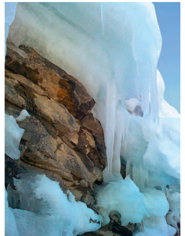
Bizarre Eisfelsen.